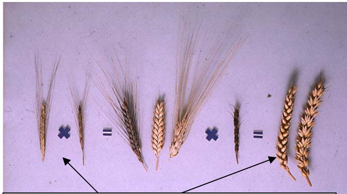
Weizen: Wildform und Kulturform durch Einkreuzung