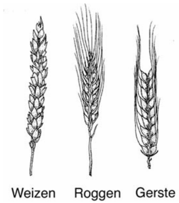
Weizen Roggen Gerste